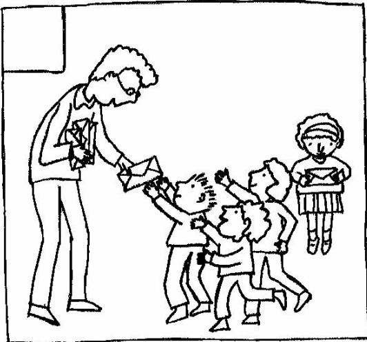
El profesor/a entrega una carta

Lee y numera las viñetas según la secuencia. Colorea las escenas en las que el niño realiza su tarea.