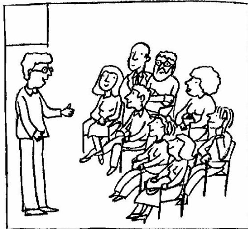
Los padres van a la reunión